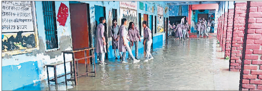
झंझर। शहीद रमेश कुमार राजकीय मॉडल संस्कृति विद्यालय में पानी में खड़ी छत्राएं।

झंझर में 52, बादली में 15, बेरी में 3 एमएम, मातनहेल में 15 और साल्हावास में 16 व बहादुरगढ़ में 92 एमएम बारिश