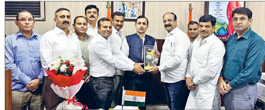
बहादुरगढ़। कमीशन के चेयरमैन को स्मृति चिह्न देते एसोसिएशन पदाधिकारी।