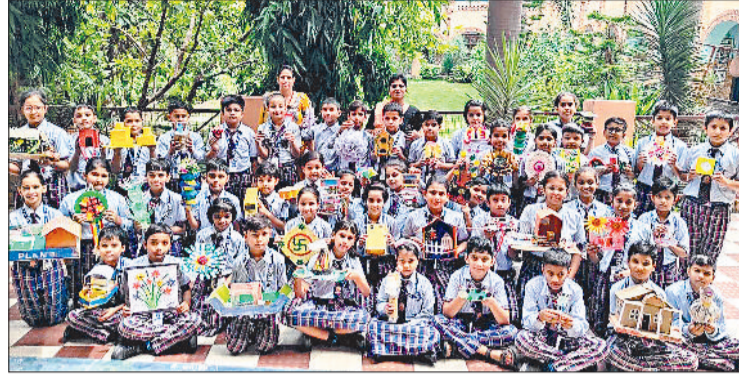
झज्जर। वेस्ट सामग्री से बनाए आकर्षक मॉडल दिखाते हुए विद्यार्थी।

एचडी वरिष्ठ माध्यमिक विद्यालय साल्हावास में मंगलवार को बेस्ट आउट ऑफ वेस्ट प्रतियोगिता का आयोजन किया गया।