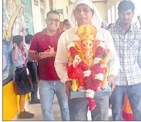
झज्जर। गणेश प्रतिमा को विसर्जन को ले जाते स्कूल प्रबंधन समिति सदस्य।