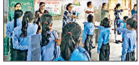
बहादुरगढ़। कार्यक्रम में शपथ लेते शिक्षक व विद्यार्थी।