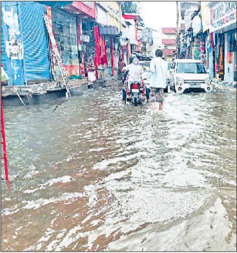
झंझर। शहर के अंबेडकर चौक पर हुए जलभराव के बीच गुजरते हुए वाहन।

झंझर में 52, बादली में 15, बेरी में 3 एमएम, मातनहेल में 15 और साल्हावास में 16 व बहादुरगढ़ में 92 एमएम बारिश