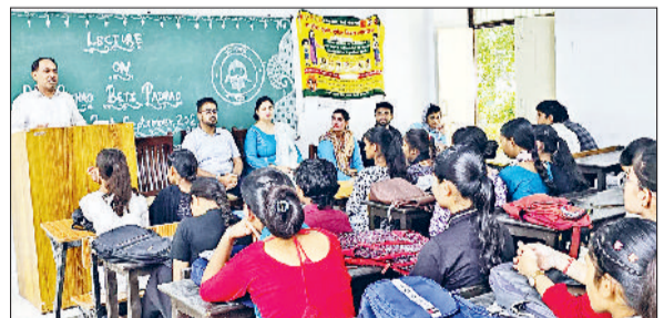
बहादुरगढ़। कार्यक्रम में विद्यार्थियों को जागरूक करते विशेषज्ञ।