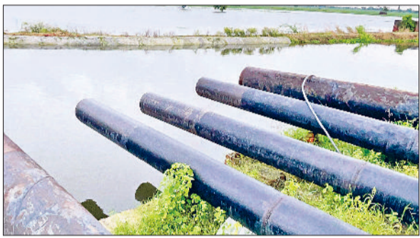
बहादुरगढ़। ड्रेन में डिवॉल्टिंग के लिए लगाए गए पंप।

छुड़ानी में धान की फसल के साथ डूबे किसानों के अरमान